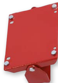
Art. 9767 Art. 9768

Para la selección de tuberías ver tabla en la página 220-221.